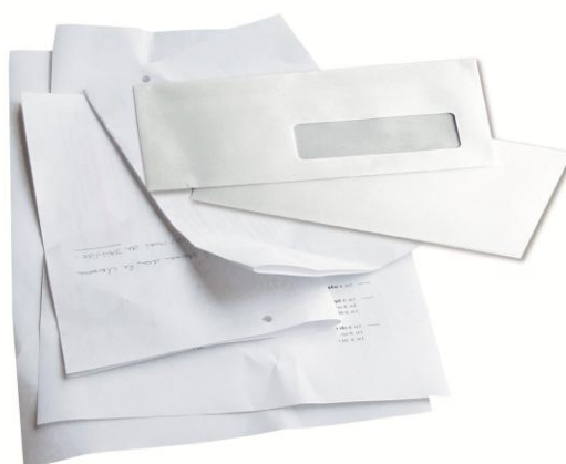
Papiers de bureau