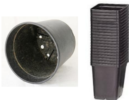
Pots de fleurs en plastique