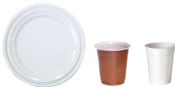
Vaisselle en plastique